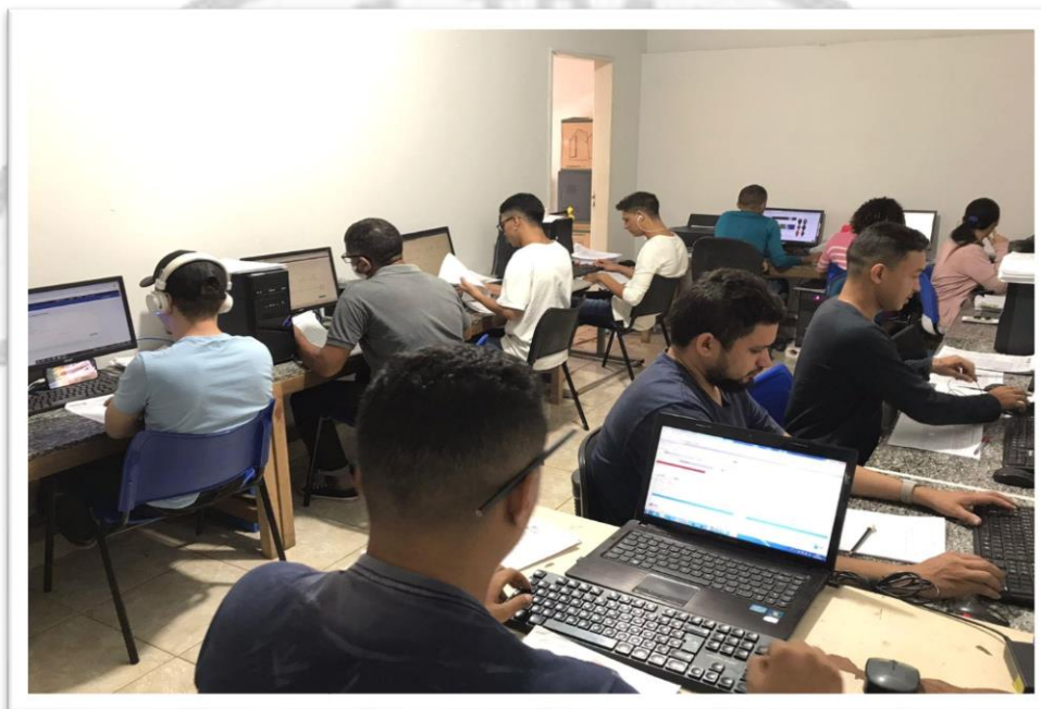
IMAGEM: departamento de regulação, controle e avaliação (DRAC), da secretaria municipal de saúde.

Bom Jardim conta com um Departamento de Controle e Avaliação com 14 digitadores e operadores de sistemas, para o controle e envio de produção semanalmente.