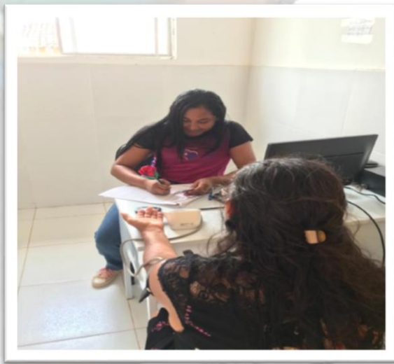
IMAGEM: Monitores para implantação do PEC – Fonte: Secretaria de Saúde